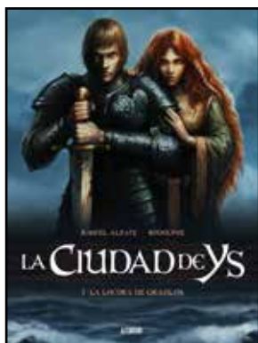
La Ciudad de Ys 1. La locura de Gradlon 48 páginas. 14 euros ISBN: 978-84-15685-17-3