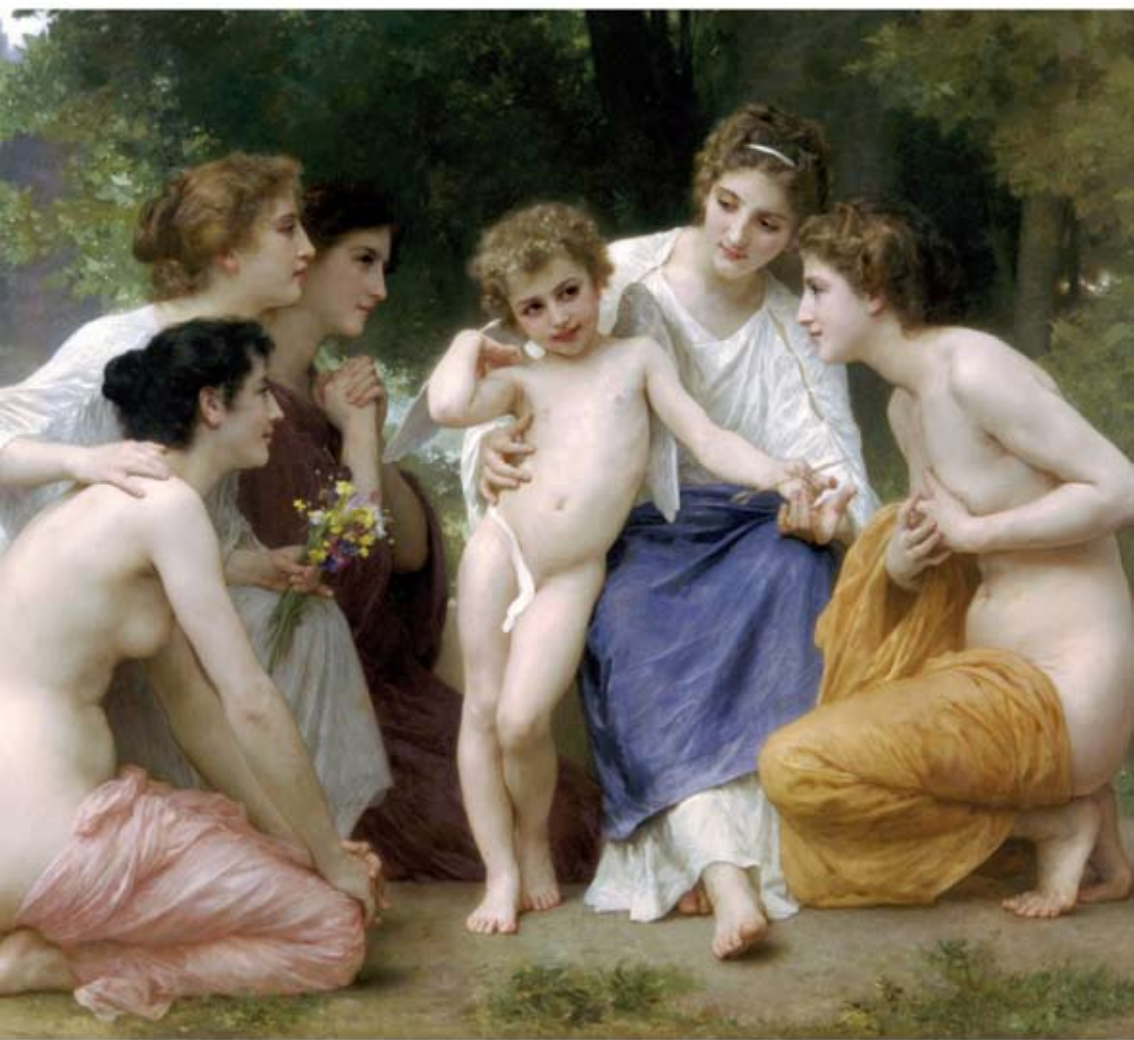
VENID A VER UN NIÑO GAYER Le petit papillon , Adolphe William Bouguereau.