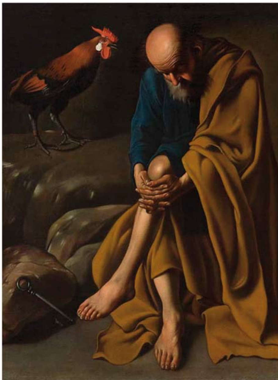
LA GALLINA PSICÓLOGA Juan Bautista Maíno.