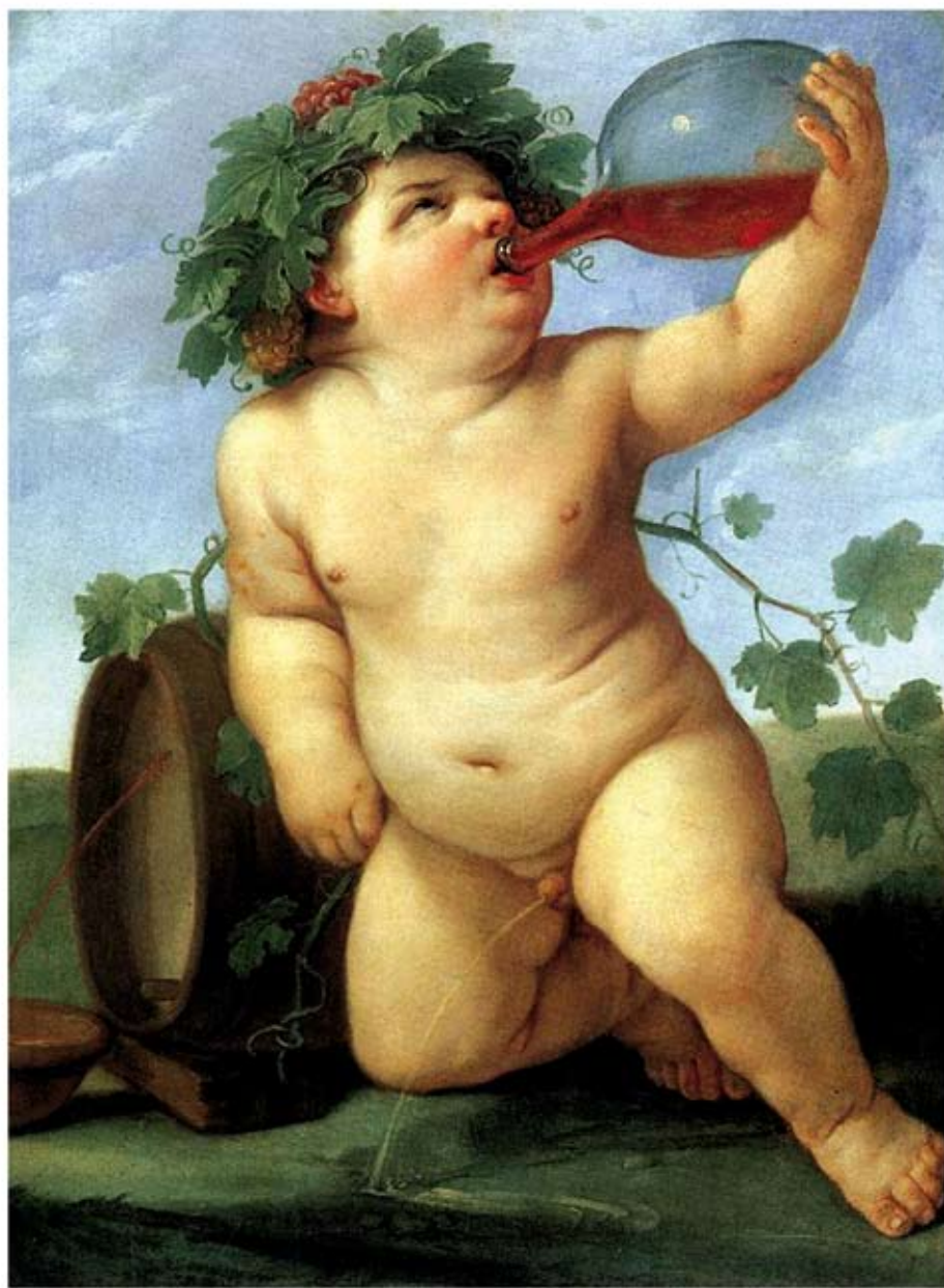
JUVENTUD SIN VALORES Il bambino alcolicci, Guido Reni.