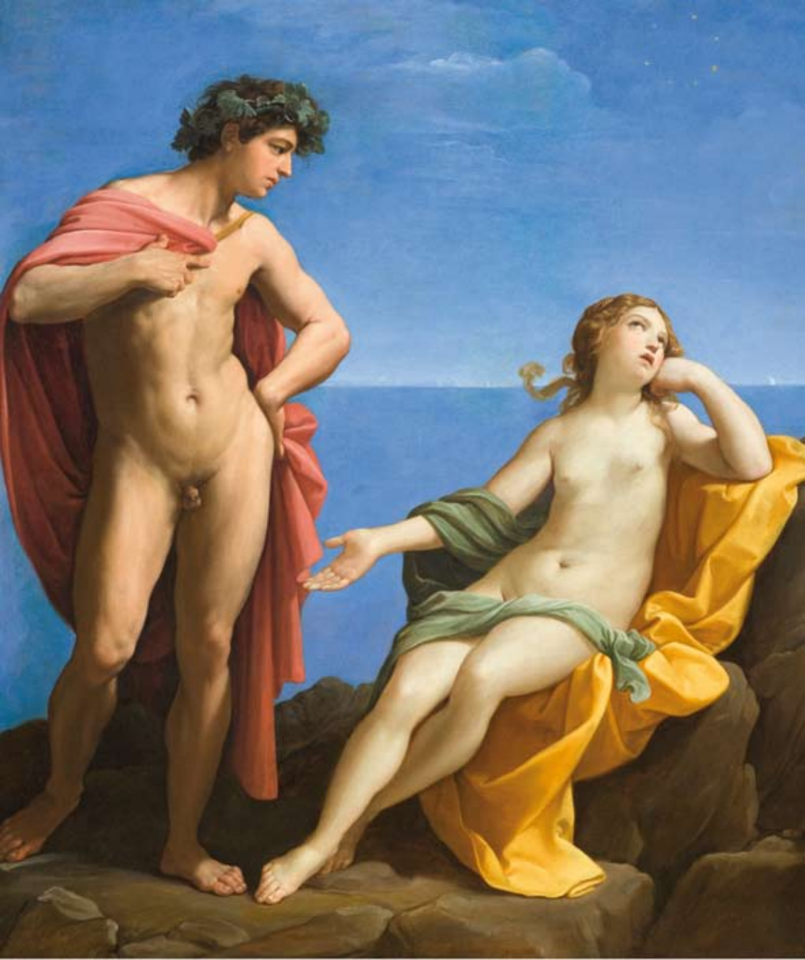
ME ABURRE TU PITO Il tuo penne sei un cognazi, Guido Reni.