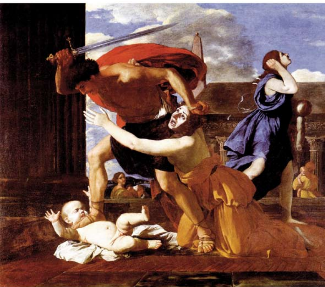
MUJER HACIÉNDOSE LA LOCA ANTE UN PARRICIDIO Femme prétendé parler on le telephone, Nicolas Poussin.