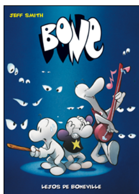
Bone 1 Lejos de Boneville 3. a edición 144 páginas. 9 euros ISBN: 978-84-92769-47-6