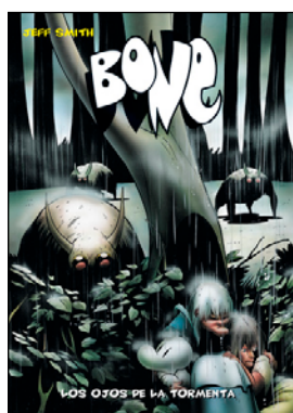
Bone 3 Los ojos de la tormenta 192 páginas. 15 euros ISBN: 978-84-92769-60-5