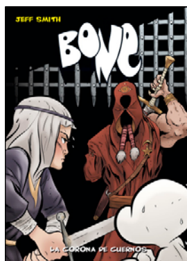
Bone 9 La corona de cuernos 224 páginas. 18 euros ISBN: 978-84-15163-21-3