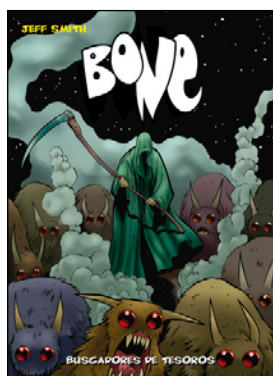
Bone 8 Buscadores de tesoros 144 páginas. 15 euros ISBN: 978-84-15163-01-5