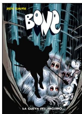
Bone 6 La cueva del anciano 128 páginas. 15 euros ISBN: 978-84-92769-86-5