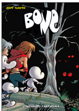
Bone 7 Círculos fantasma 160 páginas. 15 euros ISBN: 978-84-15163-00-8