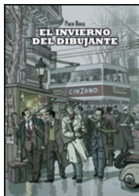
El invierno del dibujante 128 páginas. 16 euros ISBN: 978-84-92769-81-0