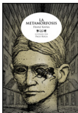
La metamorfosis (libro ilustrado; texto de Franz Kafka) 240 páginas. 20 euros ISBN: 978-84-15163-41-1