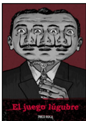
El juego lúgubre 80 páginas. 13 euros ISBN: 978-84-15163-58-9