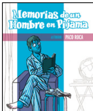
Memorias de un hombre en pijama 136 páginas. 16 euros ISBN: 978-84-15163-31-2