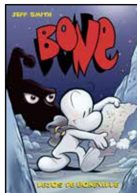
Bone (serie de 9 tomos) Tomo 1 144 páginas. 17 euros ISBN: 978-84-93508-89-0