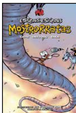
Estúpidas, estúpidas mostrorratas 104 páginas. 14 euros ISBN: 978-84-96815-19-3