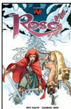
Rose 160 páginas. 15 euros ISBN: 978-84-96815-57-5